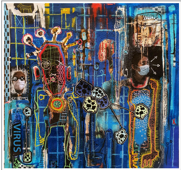
« Covid Contagious Fear » Mederic Turay - Mars 2020.

Après l'Asie, l'Europe, le reste du monde observe avec appréhension la progression du Covid-19 vers l'Afrique, continent encore relativement épargné par la pandémie... mais pour combien de temps encore?